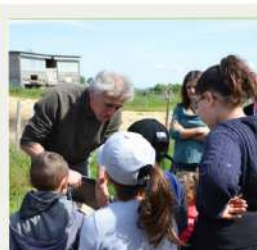
Visite de ferme